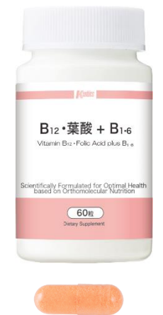
B 12 ・葉酸+B 1-6