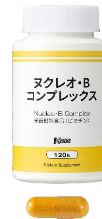
ヌクレオ・B コンプレックス