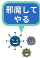
身体・精神が不安定に

マリヤ・クリニックでは、障害や病気を抱えた人の様々な困難を理解しておりますので、ご遠慮なくご事情をお伝えください。大事なことは、協力して治療に取り組むということです。